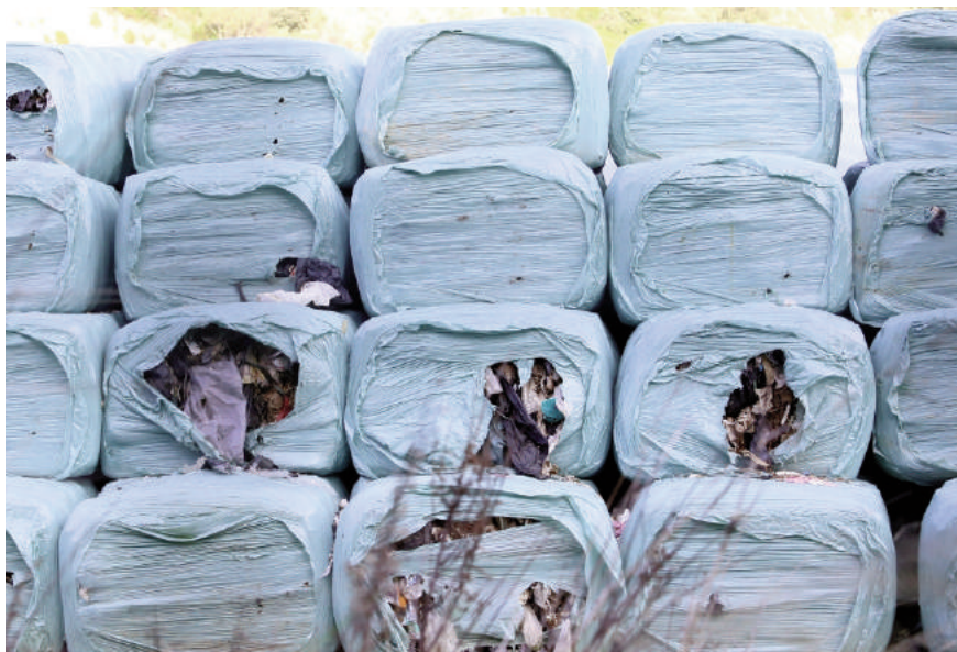
Balles de déchets stockées sur le site de Saint Antoine à Ajaccio